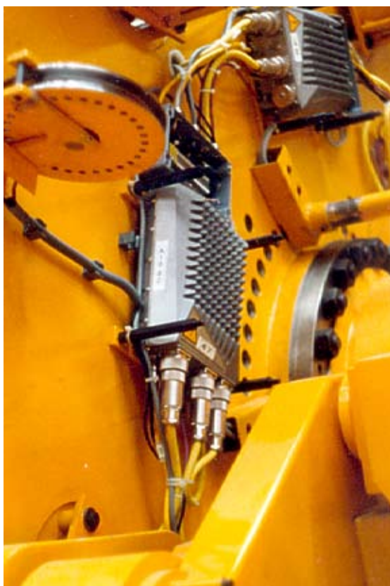
Blick auf ANDRAS Servosysteme, die mit bis zu 4g beschleunigt werden

Beide Verseilkräfte wiederum bilden zusammen eine einzige Gesamtintelligenz, die von einem übergeordneten Siemens-Leitsystem die Auftragsdaten übermittelt bekommt.