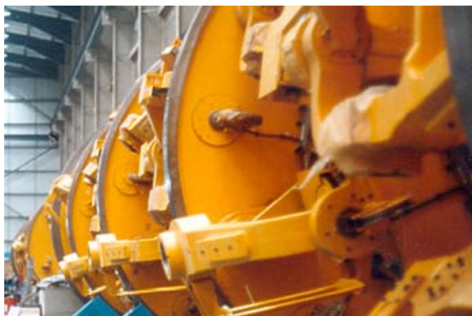
Blick auf ANDRAS Servosysteme, die mit bis zu 4g beschleunigt werden

Mittels der in den dezentralen ANDRAS Servosystemen integrierte CNC und SPS-Funktionalität und die Vernetzung über BITBUS, bilden die beiden Verseilkräfte mit