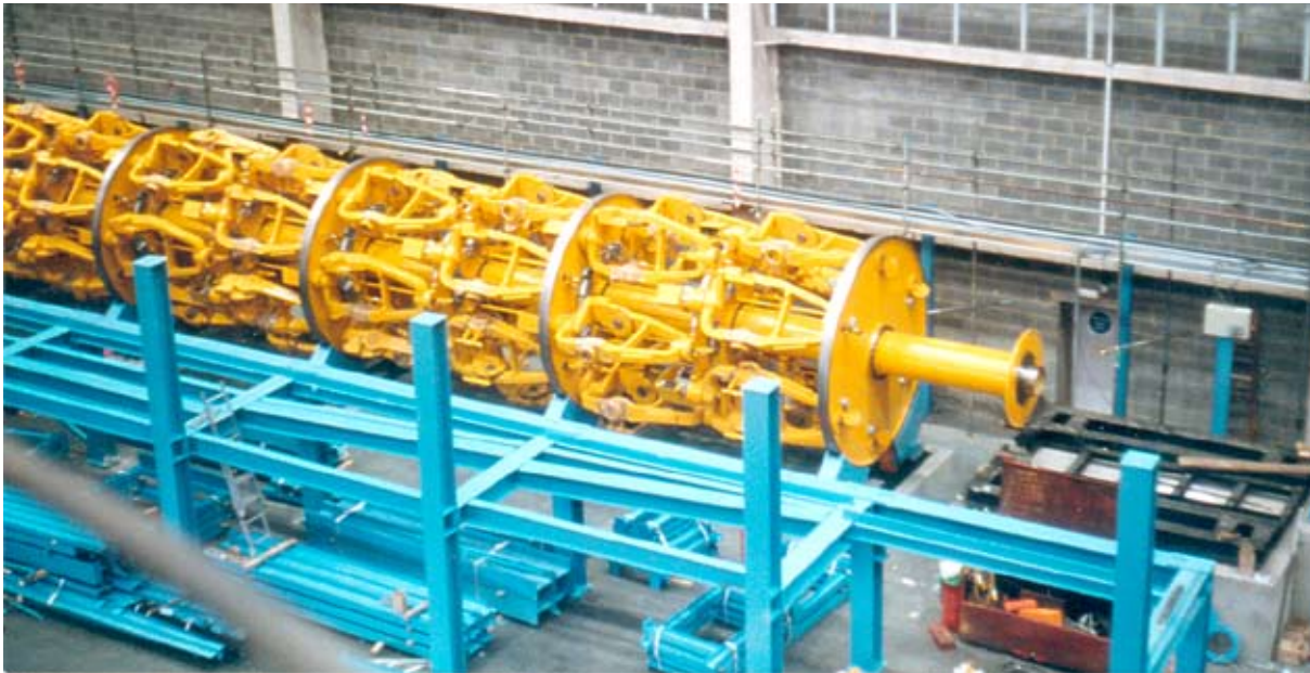
Drahtkorb Nr. 1 während der Anlagenaufbauphase

Das Systemhaus ANDRAS Steuerungssysteme GmbH bietet umfassendes Know-how zur Umsetzung besonderer Automationskonzepte.