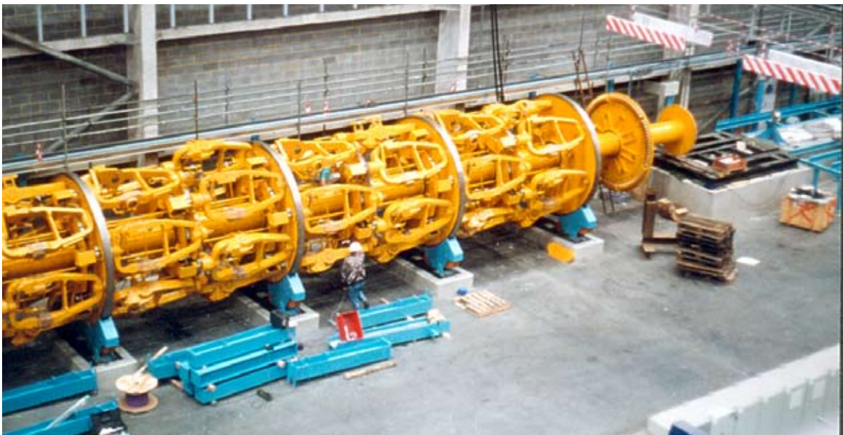
Drahtkorb Nr. 2 während der Anlagen-Aufbauphase

Eine Störung der Produktion, z. B. durch Drahtbruch, macht die laufende Produktion unbrauchbar und ist daher der sensibelste Faktor.