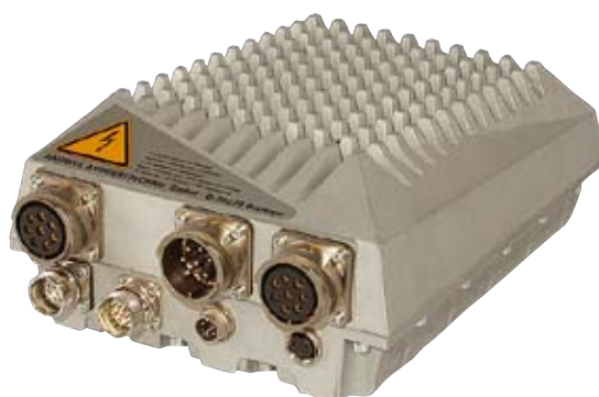
ANDRAS Servosystem Typ: DMCU-A4 (400V, 4A)

Gleichzeitig wird durch Gegenrotation der Spulenträger die Drahtverdrallung ausgeglichen und ein möglicher Drahtbruch überwacht.